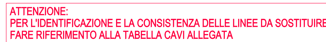
PLANIMETRIA 2° ORDINE